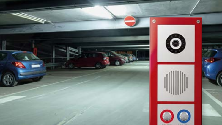
Notrufsprechstellen mit Kamera für mehr Sicherheit, z. B. in der Tiefgarage