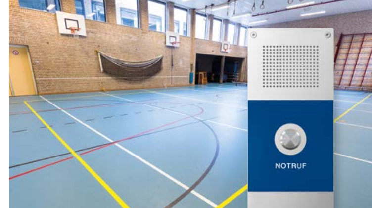
Hausnotruf (Serie 40) mit Direktrufftaste zu einer 24 h besetzten Stelle