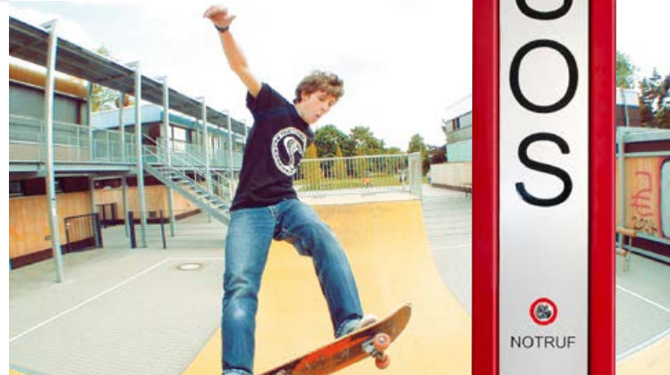
Behnke Standsäulen zum Einsatz im Innen- und Außenbereich lassen sich flexibel bestücken